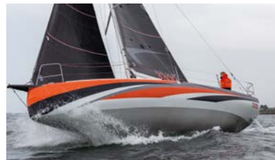
Sun Fast Race short-handed or with crew Course en solitaire comme en équipage