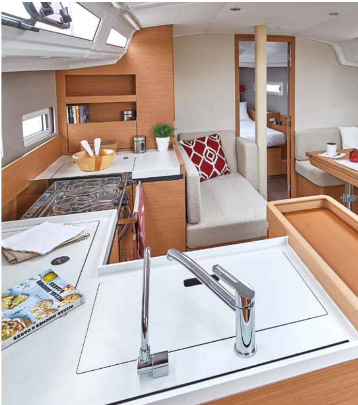
▲ A great central U-shape galley, very functional Une grande cuisine centrale en U, très fonctionnelle Eine grandiose Pantry in U-Form, sehr funktionell! Una gran cocina central en forma de U, muy funcional Una grande cucina centrale a forma di U, molto funzionale