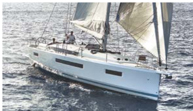
Sun Odyssey Elegance and performance Élégance et performance

Discover all these and more at www.jeanneau.com , or at your local Jeanneau Dealership.