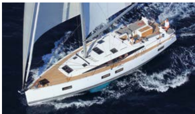
Jeanneau Yachts Luxury and ocean sailing Luxe et grande croisière